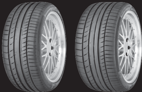
Vorderachse **) / Rundum